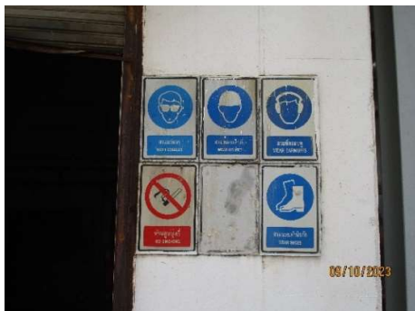
รูปที่ 2-10 ป้ายเตือนด้านความปลอดภัยในพื้นที่โครงการ