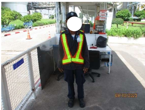
รูปที่ 2-18 เจ้าหน้าที่รักษาความปลอดภัย