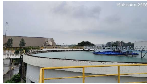
รูปที่ 2-13 โรงกรองน้ำเพื่อผลิตน้ำประปา