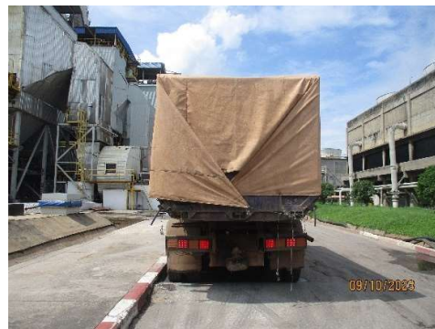
รูปที่ 2-19 การปิดคลุมกระบะรถบรรทุก