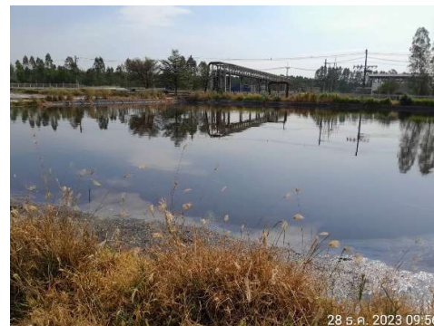
รูปที่ 2-26 Emergency Basin