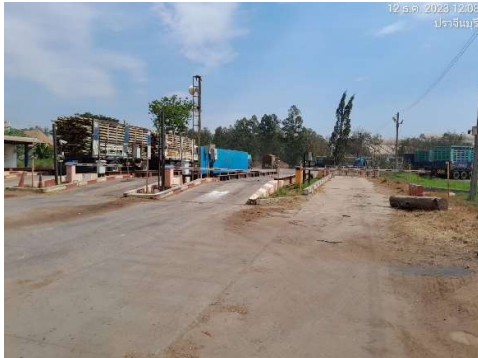
รูปที่ 2-20 จุดขังน้ำหนักรถบรรทุกทุกเช้า