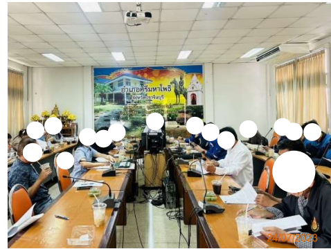
รูปที่ 2-2 การประชุมคณะกรรมการไตรภาคี