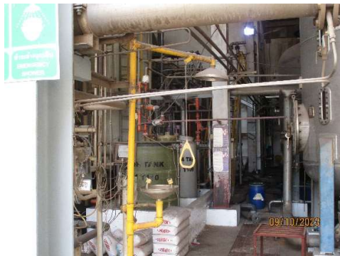
รูปที่ 2-25 ฝักบัวและอ่างล้างตาฉุกเฉิน