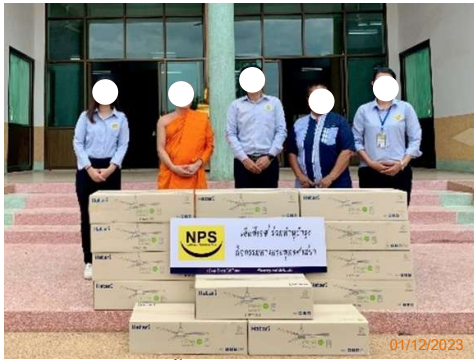
รูปที่ 2-1 การลงพื้นที่เพื่อประชาสัมพันธ์โครงการ