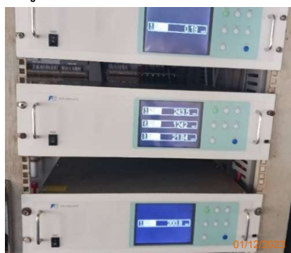
CEMs Power Boiler