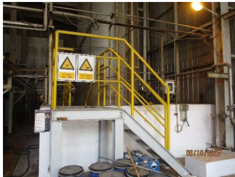
รูปที่ 2-22 พื้นที่เก็บสารเคมี และการติดป้ายเตือนอันตรายจากสารเคมี