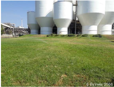
รูปที่ 2-14 การนำน้ำไปใช้ประโยชน์ในพื้นที่สีเขียว