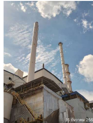
รูปที่ 2-4 ปล่องระบายอากาศของโครงการ