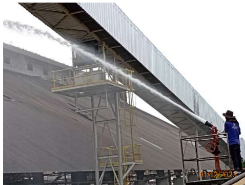
รูปที่ 2-23 การฉีดพรมน้ำบริเวณลานกองเชื้อเพลิง