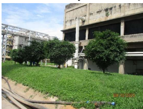
รูปที่ 2-11 พื้นที่สีเขียวรอบพื้นที่โรงงาน