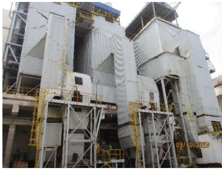
รูปที่ 2-6 ระบบดักฝุ่นแบบไฟฟ้าสถิต (ESP)