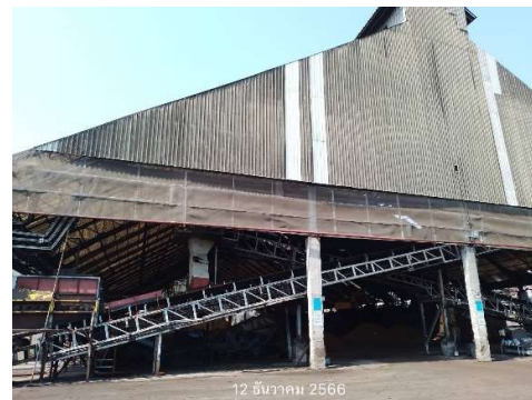
รูปที่ 2-24 การจัดพื้นที่บริเวณลานกองเชื้อเพลิง