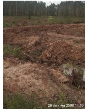
รูปที่ 2-21 ค้นดินล้อมแปลงปลูกยูคาลิปตัส