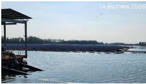
รูปที่ 2-12 พื้นที่อ่างเก็บน้ำและสวนป่า