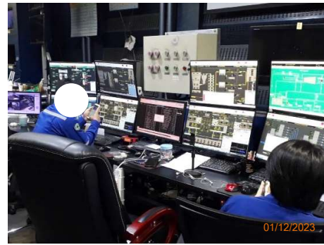
รูปที่ 2-7 ห้องควบคุมการผลิต