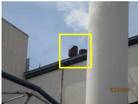
รูปที่ 2-8 Silencer บริเวณ Valve ท่อส่งไอน้ำ