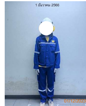
รูปที่ 2-9 พนักงานสวมใส่อุปกรณ์ ป้องกันอันตรายส่วนบุคคล