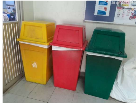
รูปที่ 2-15 ภาพรวบรวมกากของเสียหรือขยะมูลฝอย