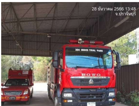
รูปที่ 2-3 รถดับเพลิงภายในโครงการ