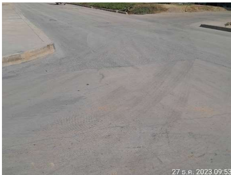
รูปที่ 2-16 พื้นที่ล้างล้อรถบรรทุก