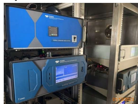
CEMs Recovery Boiler PP6