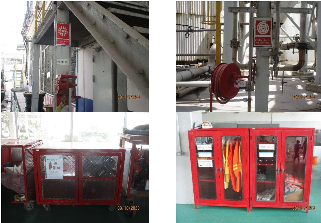
รูปที่ 2-27 อุปกรณ์ป้องกันอัคคีภัยภายในพื้นที่โครงการ